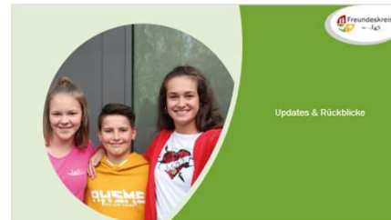
Updates & Rückblicke