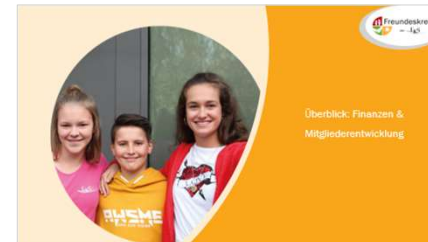
Überblick: Finanzen & Mitgliederentwicklung