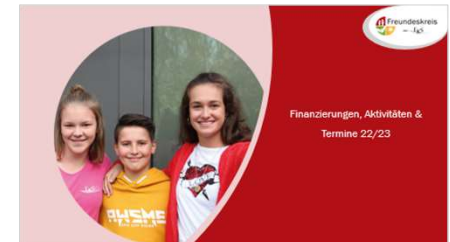
Finanzierungen, Aktivitäten & Termine 22/23