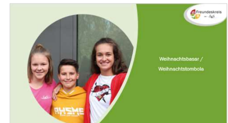
Weihnachtsbasar / Weihnachtstombola