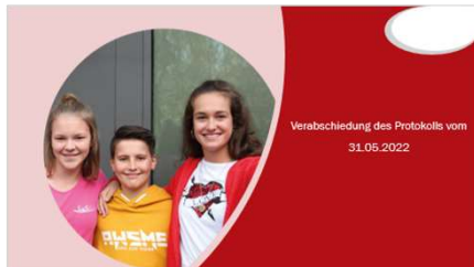
Verabschiedung des Protokolls vom 31.05.2022