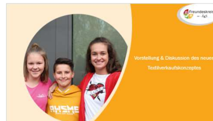
Vorstellung & Diskussion des neuen Textilverkaufskonzeptes