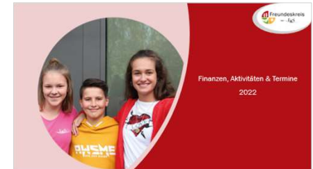
Finanzierungen, Aktivitäten & Termine 2022