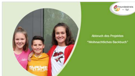
Abbruch des Projektes „Weihnachtliches Backbuch“