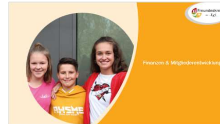
Finanzen & Mitgliederentwicklung