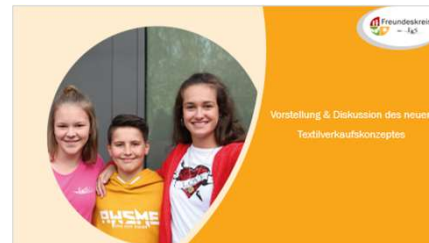
Vorstellung & Diskussion des neuen Textilverkaufskonzeptes