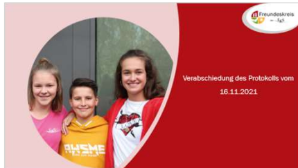
Verabschiedung des Protokolls vom 16.11.2021