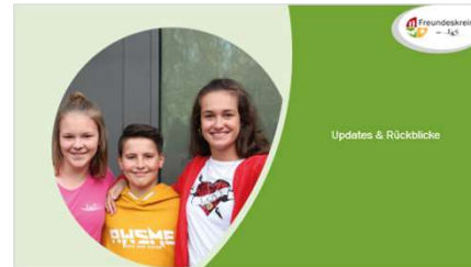
Updates & Rückblicke